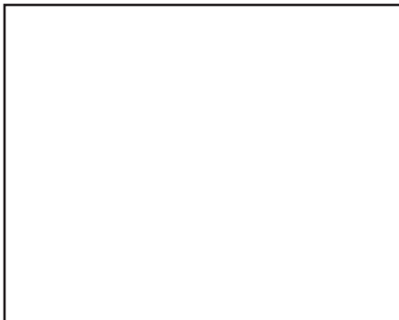
एक मिल मज़दूर